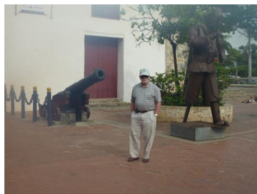
Museo Naval del Caribe