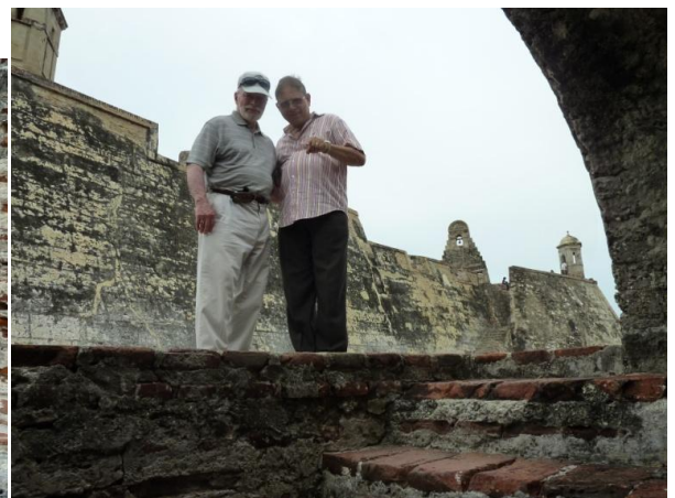
Entrada a uno de los túneles del Castillo

Muestra de la artillería estratégicamente ubicada en el Castillo, la cual era utilizada para defender la ciudad de los ataques de piratas.