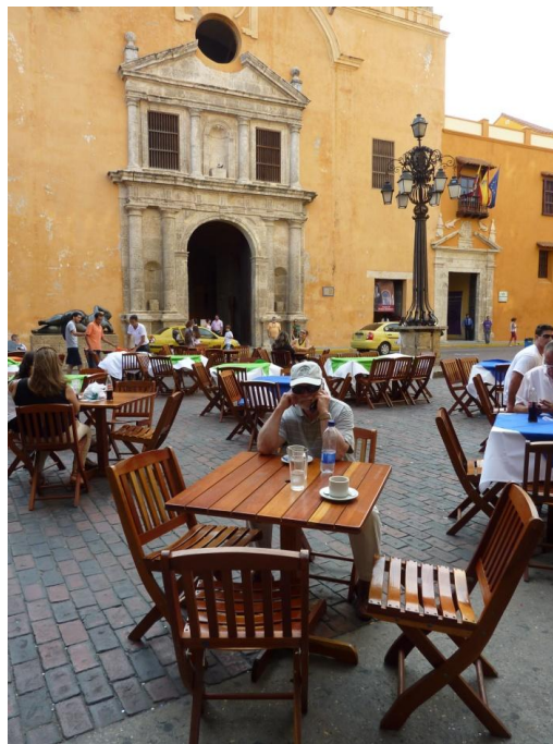
Plaza de Santo Domingo, al fondo la Iglesia que lleva su mismo nombre