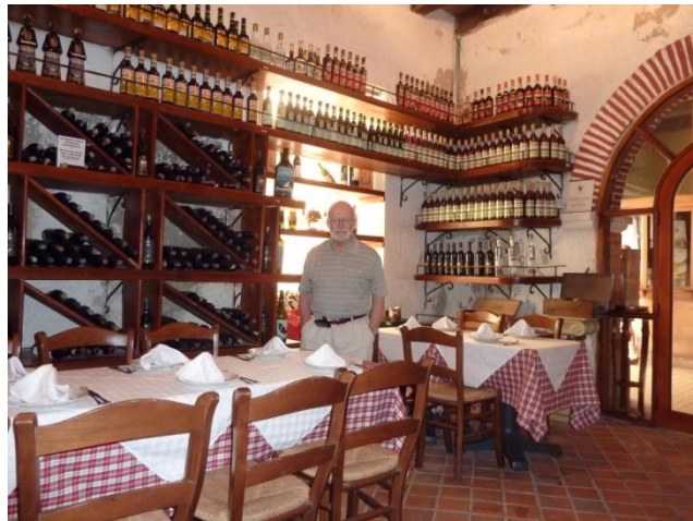
La Cava, en el Restaurante Enoteca

Plaza de Bolívar, en cuyo centro se levanta la Estatua del Libertador Q. H. Simón Bolívar, en la que se lee la inscripción " Si Caracas me dio la vida, Cartagena me dio la Gloria ". Es considerada la Plaza Mayor de la ciudad por su cercanía con el Museo del Oro, Banco de la República, Palacio de la Inquisición, la Catedral y la Gobernación del Departamento de Bolívar.